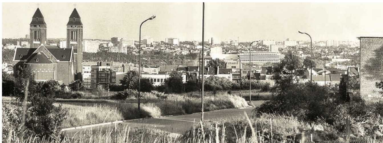
Panoramische foto van Neder-Over-Heembeek uit 1974, samengesteld door Alfons Franssens. Foto getrokken vanuit de Kraatveldstraat met zicht op de Sint-Pieter en Pauwelkerk en de Zennevallei. - Foto uit de collectie van Jean-Pol Vansteenbergh - Erfgoed Heembeek-Mutsaard