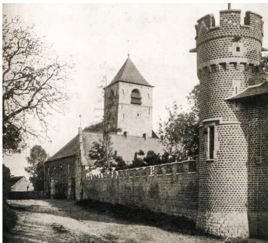
Poort en muur van het Meudonkasteel gebouwd in 1870. Daarnaast de Sint-Pieterkerk en De Kluis gebouwd in 1487. - Foto uit de collectie van Jan Verbesselt - Erfgoedbank Heembeek-Mutsaard

Dit monument van kunstenaar Albin Courtois werd op 24 mei 1975