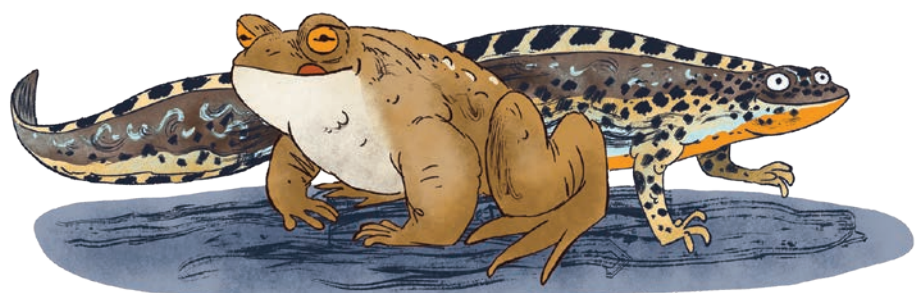
Tekening 'gewone pad en alpenwatersalamander' door Wauter Mannaert. - Licentie Creative Commons Naamsvermelding, Gelijk Delen.