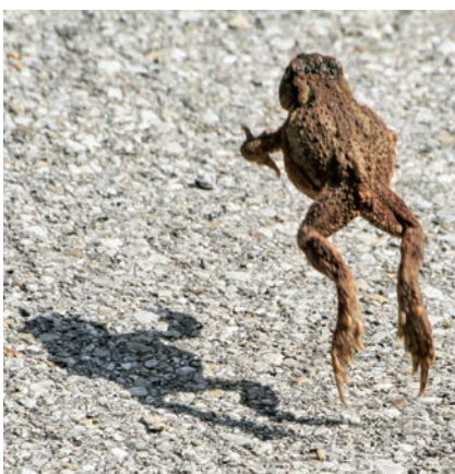
'Toad jumping near Fürstentfeldbruck in Bavaria' door N p holmes. - Licentie Creative Commons Naamsvermelding, Gelijk Delen.