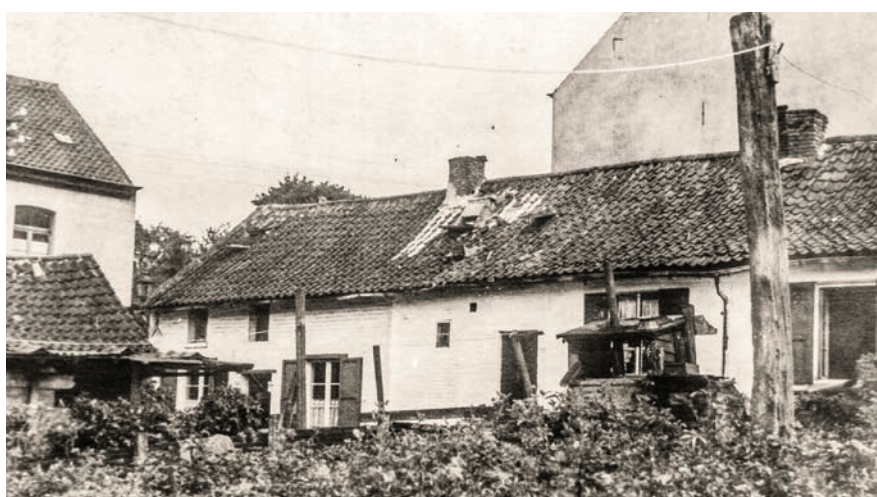
Lage gebouwen rechtover het pachthof den Bels (Beizegemhoeve).

Bronnen: Het Laatste Nieuws (1-2 augustus 1970), de kronieken van Jan Verbesselt, Erfgoedbank Heembeek-Mutsaard, archief CCB, cel Historisch Erfgoed Stad Brussel. Zo was Heembeek (nieuwe uitgave), p. 15.