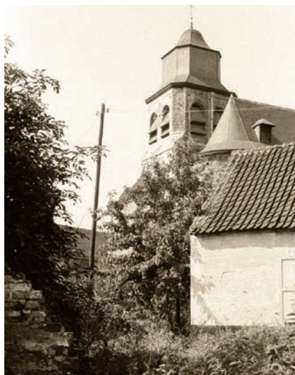
De Sint-Niklaaskerk in 1958, gezien vanuit de tuin van een van de oude huisjes ernaast.

De specifieke benaming voor elk van de twee parochies verwijst naar het dorp dat zich "stroomopwaarts" van de beek bevond (Over-Heembeek)