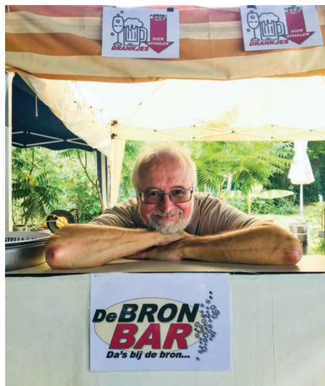
Dirk & de BronBar