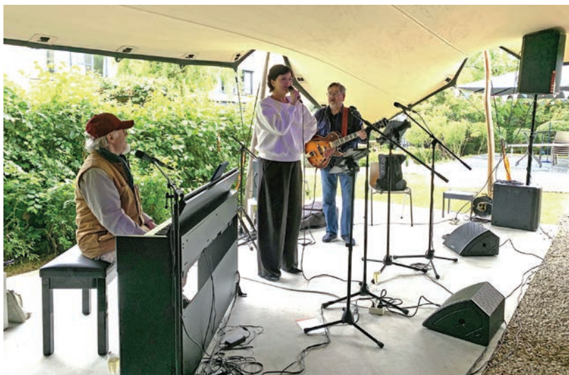
Eric Melaerts, Geena Lisa & Jean Blaute

“Ik heb het genoeg al twee jaar elke maand voor wat muziek en entertainment te zorgen in WZC De Overbron. Een nieuwe wereld ging voor mij open, vol warmte, vriendschap en een droompubliek dat bijzonder aandachtig luistert, meezingt en waardering toont. Dank is mijn deel. Het jaarlijkse tuinfestival is echt uniek. Een ruim en gevarieerd aanbod aan optredende zangers en acteurs dient zich aan en we genieten samen met bewoners, familieleden en sympathisanten van de sfeervolle setting. Ook dit jaar zal ik mijn opwachting maken met een stel vrienden-muzikanten. Ik kijk er alweer naar uit!”